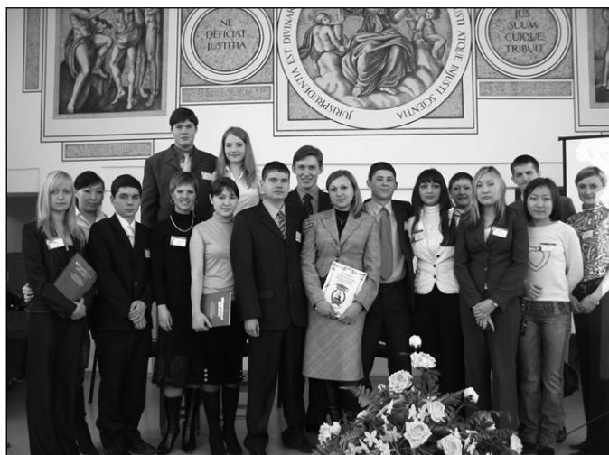
14 апреля 2007 г. состоялось Учредительное собрание студенческого научного общества Юридического института ИГУ

Юридический институт ИГУ является базовым юридическим вузом Сибири по проведению Летних правовых школ. С августа 2002 года совместно с университетами Германии и Голландии для студентов института проводятся Летние правовые школы и Летние правовые акаде-